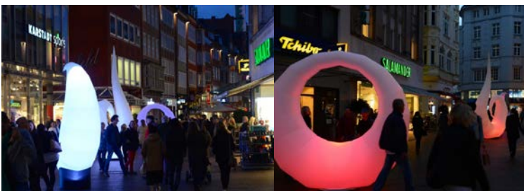
Beispiele für gemietete Beleuchtung durch Drittanbieter

Ergänzend können entsprechende Beleuchtungseinheiten zu ausgewählten Events angemietet werden. Siehe folgende Abbildung: