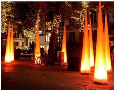
„Airlights“ der CI Bremen

Einige sog. Airlights befinden sich im Eigentum der CityInitiative Bremen Werbung e.V. (CI) und können durch diese eingesetzt werden.