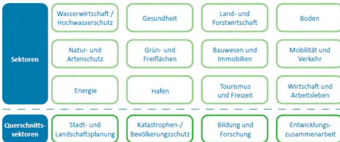
Abb. 2: In der Strategieentwicklung betrachtete „Sektoren“

Im Rahmen der ersten beiden Arbeitsschritte (Bestandsaufnahme und Betroffenheitsanalyse) wurden vorhandene Daten ausgewertet, die Betroffenheit in den jeweiligen Handlungsfeldern analysiert und priorisiert. Bei der Betroffenheitsanalyse werden sowohl funktionale als auch räumliche Betroffenheiten betrachtet. Räumliche Betroffenheitsanalysen stellen z.B. die Stadtklimaanalyse oder Abschätzungen zur räumlichen Verteilung von klimawandelbedingt veränderten Grundwasserständen dar. Zentrale Frage ist, wo sich in den beiden Stadtgebieten durch die Klimaveränderung besonders beeinflusste Bereiche befinden.