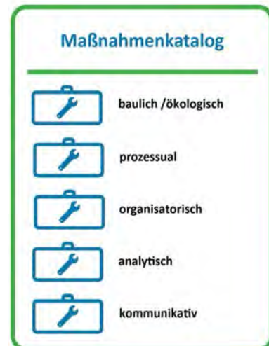
Abb. 4: Mögliche Maßnahmenkategorien

Diese Kommunikationsstrategie soll die weitere Konkretisierung und Umsetzung von identifizierten Maßnahmen und Projekten unterstützen und insbesondere eine differenzierte Kommunikation und Beteiligung mit/von Bürgerinnen und Bürgern ermöglichen.